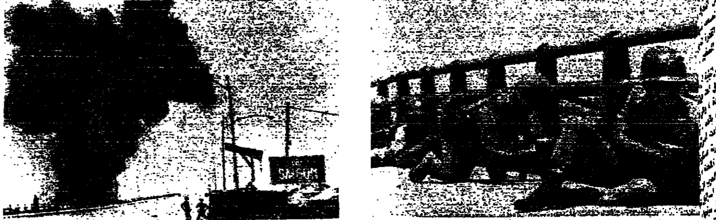
جنود فيتناميون يتخذون مواقع لهم على جسر في سايغون أثناء القتال

تصفت طائرة تابعة لسلاح الجو الفيتنامي الجنوبي ، القصف الجمهوري من الطائرات بمساعدة مواقع حكومية اخرى بعد قتل من دعوة الرئيس الجديد الجنرال تونغ فان منه الى وقف إطلاق النار بين القوات الحكومية والقرار . وقالت وكالة « رويترز » انه يعتقد بان هذه الهجمات هي بداية انداز موجه من القادة العسكريين المخلصين ضد اربعة تحركات متتالية يقوم بها الرئيس الجديد . وقام حرس القصر بإطلاق نيران مدافعهم الرشاشة على الطائرة الفيتنامية التي هاجمت مقر الرئاسة اثر تصويب الرصاص الجديد . وكان الرئيس منه قد عين السناتور فرانك مان رئيس حركة التسوية الوطنية التي يدعوها الفيتناميون رئيسا لوزارته ، كما عين ثيو فان هوين رئيس مجلس الشيوخ السابق واحد من قادة الحركة ، ثانيا لرئيس الجمهورية . وبينما كان إطلاق النار ممتلعا حول